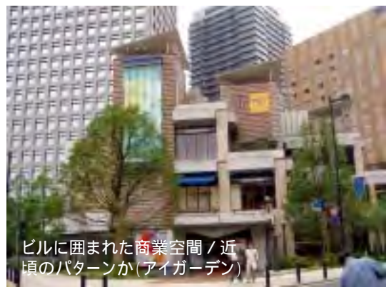
ビルに囲まれた商業空間 / 近頃のパターンか(アイガーデン)