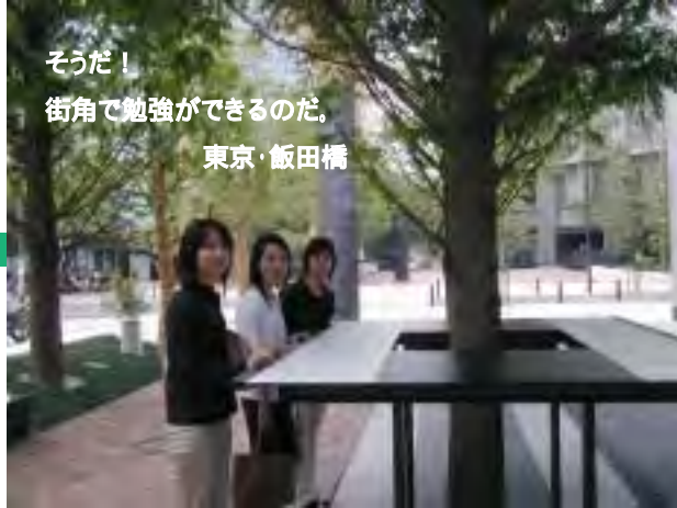
そうだ！ 街角で勉強ができるのだ。 東京・飯田橋