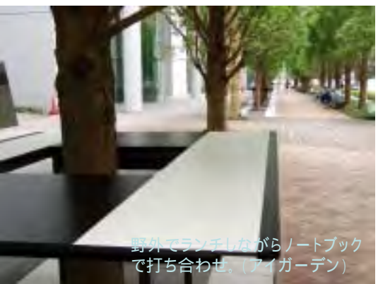
野外でランチしながらノートブックで打ち合わせ。(アイガーデン)