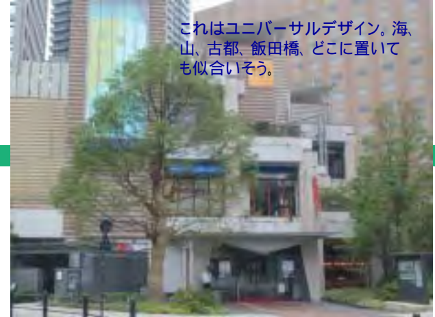
これはユニバーサルデザイン。海山、古都、飯田橋、どこに置いても似合いそう。