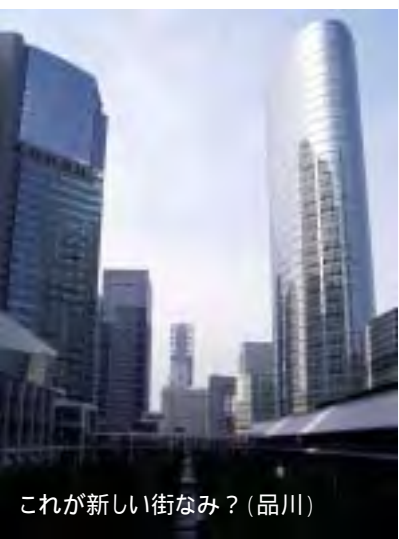
これが新しい街なみ？(品川)