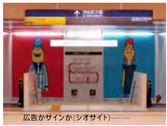
広告かサインか(シオサイト)