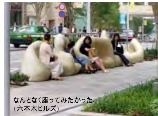
なんとなく座ってみたかった。(六本木ヒルズ)