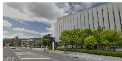
茅野市民館と西口広場