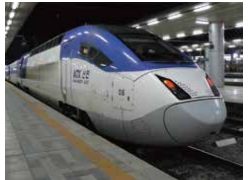
韓国高速鉄道 KTX 京釜線 ソウル駅または釜山駅から、東大邱下車 ※すべての列車は東大邱駅に停車します