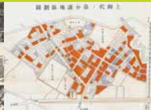
上御代の台分譲地区画図（昭和13年）