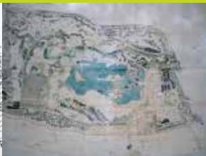
加賀藩下屋敷絵図