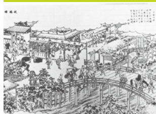
江戸名所図会（板橋宿）