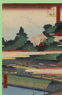
名所江戸百景 市ヶ谷八幡